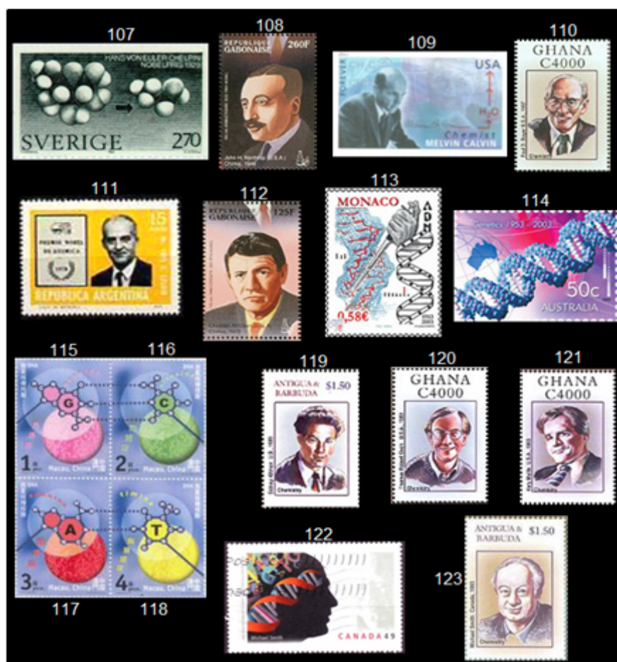
Fig. 13 Sellos postales, laureados con el Premio Nobel de Química: Bioquímica

Paul Delos Boyer (1918, Estados Unidos) y John Ernest Walker (1941, Reino Unido) comparten la mitad del premio en 1997 por su elucidación del mecanismo de la síntesis del ATP, la otra mitad del premio fue para Jens Christian Skou (1918, Dinamarca) por el primer descubrimiento de la enzima transportadora de iones de sodio y potasio. El sello 110 de Ghana muestra a Boyer, uno de los galardonados con el Premio Nobel de Química en 1997.