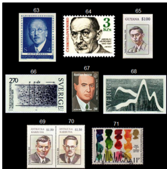
Fig. 9 Sellos postales, laureados con el Premio Nobel de Química: Química Analítica.

y al noruego Odd Hassel (1897-1981) "por sus contribuciones al desarrollo del concepto de conformación y su aplicación en química", es decir, la disposición espacial de los átomos en las moléculas, que se diferencian sólo por la orientación de los grupos químicos en la rotación alrededor de un enlace simple; los sellos 72 y 73 muestran a Barton y a Hassel; el sello 74 fue emitido en 1977 para conmemorar los 100 años del "Royal Institute of Chemistry", representa la conformación estructural de un esteroide en honor al trabajo de Barton /16/.