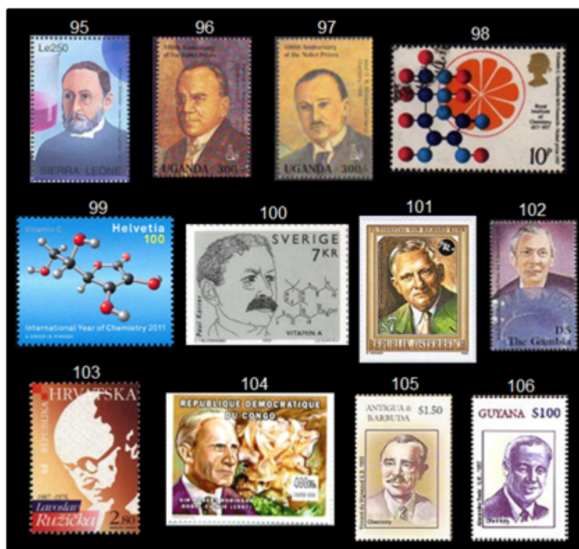
Fig. 12 Sellos postales, laureados con el Premio Nobel de Química: Química de productos naturales.

En 1955 el estadounidense Vincent du Vigneaud (1901-1978) recibió el premio por la síntesis de las hormonas polipeptídicas oxitocina y vasopresina /49/. El sello 105 muestra a Vigneaud. El inglés Alexander Robert Todd (1907-1997) ganó el premio en 1957 "por sus trabajos en nucleótidos y coenzimas". Todd (sello 106) sintetizó el ATP (adenosín trifosfato) y el ADP (adenosín difosfato), los principales portadores de energía en las células vivas /17/. La figura 12 muestra los sellos utilizados para recordar los laureados en química de productos naturales.