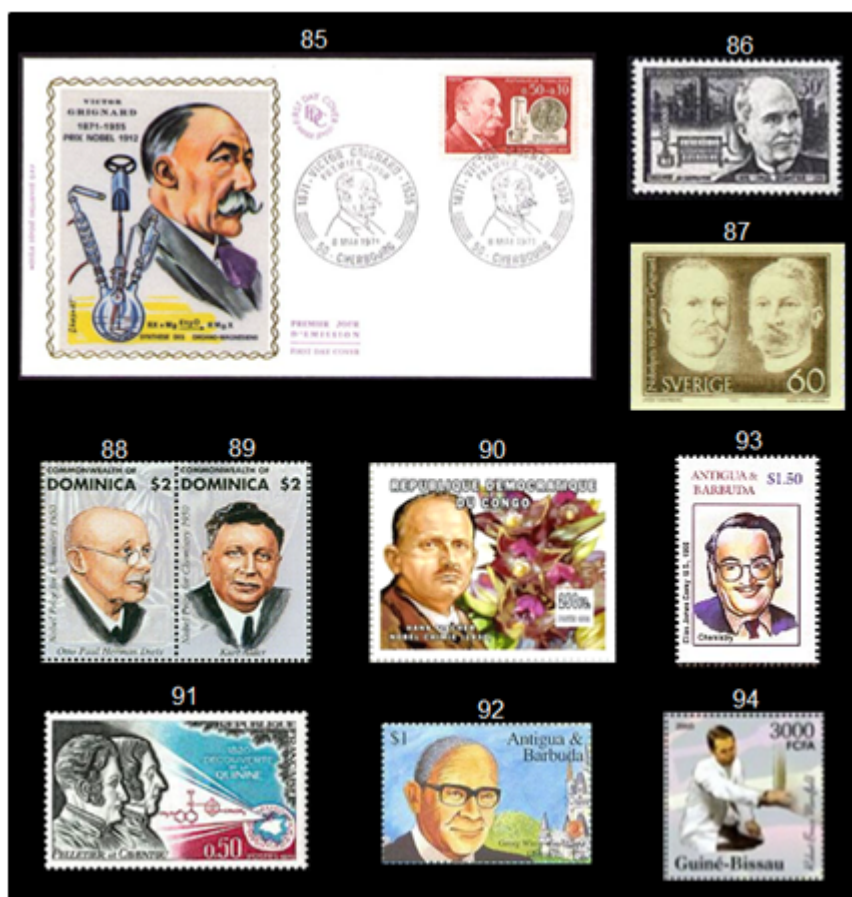
Fig. 11 Sellos postales, laureados con el Premio Nobel de Química: Química Orgánica – preparativa.

Los Premios Nobel de Química en 1927 y 1928 entregados respectivamente a los alemanes Heinrich Otto Wieland (1877-1957) y Adolf Otto Reinhold Windaus (1876-1959), están estrechamente relacionados con la estructura de los esteroides.