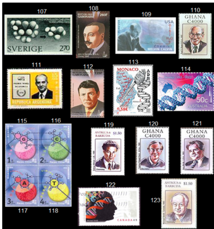
Fig. 13 Sellos postales, laureados con el Premio Nobel de Química: Bioquímica

Paul Delos Boyer (1918, Estados Unidos) y John Ernest Walker (1941, Reino Unido) comparten la mitad del premio en 1997 por su elucidación del mecanismo de la síntesis del ATP, la otra mitad del premio fue para Jens Christian Skou (1918, Dinamarca) por el primer descubrimiento de la enzima transportadora de iones de sodio y potasio. El sello 110 de Ghana muestra a Boyer, uno de los galardonados con el Premio Nobel de Química en 1997.